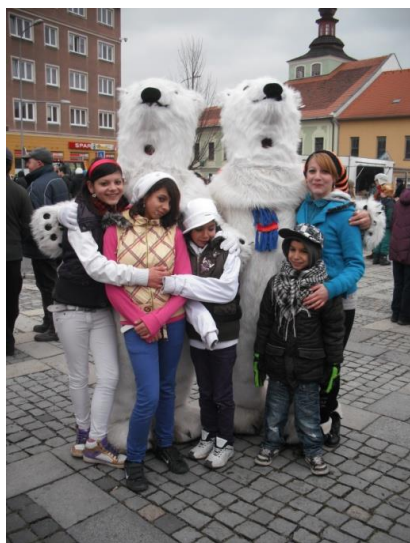
Maškary Milevsko, únor 2013

se společenských akcí pořádaných v okolí, aby si především děti mohly užít radostí, které jim jejich maminky z důvodu nízkých příjmů nemohou dopřát.