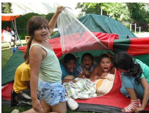
Prázdninové dobrodružství pod stanem, červenec 2013