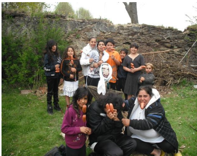
Pálení čarodějnic, duben 2013